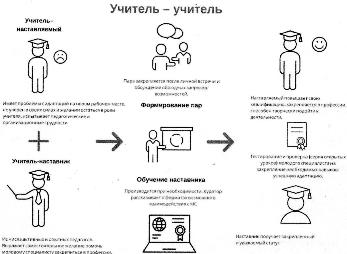
Рис.1 Графическое представление реализации программы наставничества

Куратором программы наставничества является руководитель кафедры учителей начальных классов.